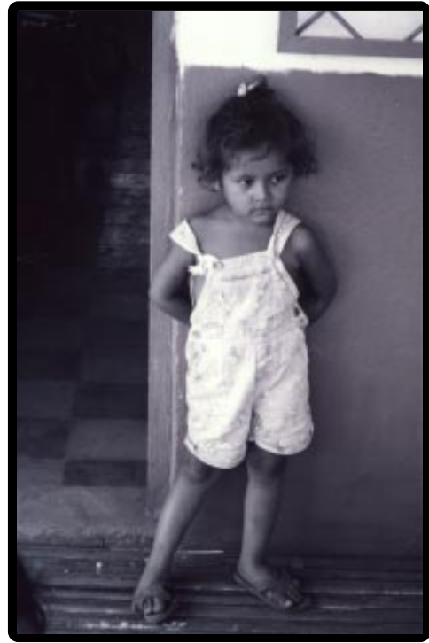
Una Niña de Tilgüe Tilgüe Child

During this April Spring Retreat we each saw new potential and opportunities for the growth of the Sister Islands Association and had a better understanding of our Ometepe counterparts and ourselves. Like gardeners, our hope is to see our actions result in a thriving and productive long term relationship.