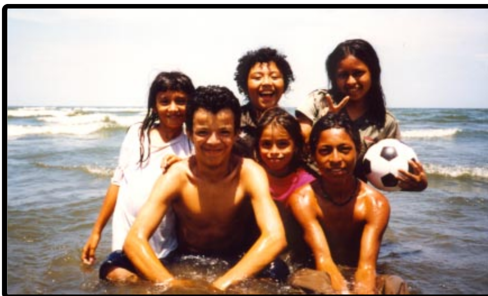
Niños en el mar dulce, La Palma

I came away from Ometepe with an understanding of cultural differences and our obligations as Americans toward developing nations. There are many ways we may improve our society by modeling aspects of it upon Ometepe's customs and people. Conversely, Ometepe, and Nicaragua as a whole, may benefit from America if only we are willing to help without exploiting, and teach without indoctrinating. We owe it to our amigos in Nicaragua, and the global community, to understand other cultures, learn from them, and give to them of ourselves.